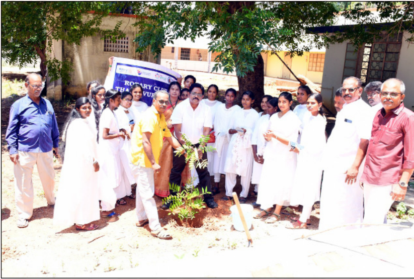
குந்தவை ரோட்டரி சங்க மரம் நடு விழா