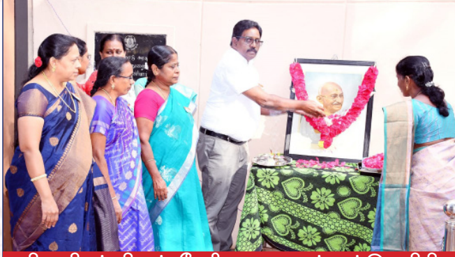
தியாகிகள் தினம்-தேசிய ஒருமைப்பாட்டு சமிதி