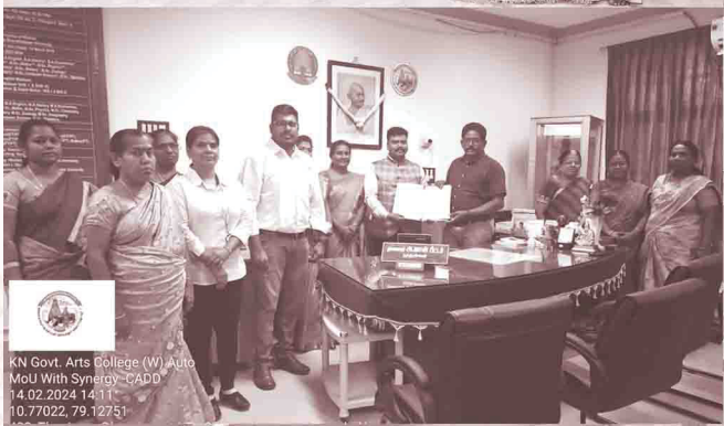
KN Govt. Arts College (W) Auto MoU With Synergy - CADD 14.02.2024 14:11 10.77022, 79.12751