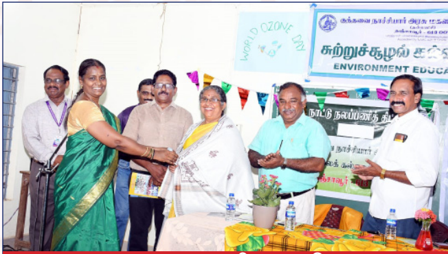
சற்றுச்சூழல் கல்விக்கழக நிகழவு