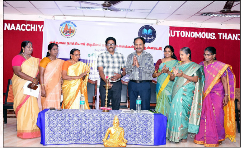
நூல் நயம் நிகழ்வு