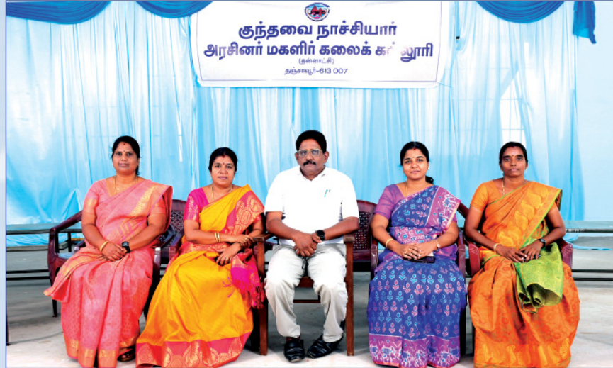
வணிக நிர்வாகவியல் துறை