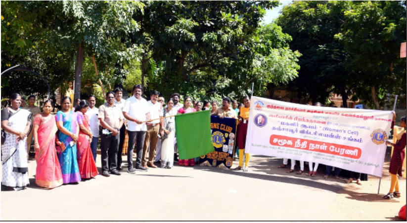
மகளிர் ஆயம் நடத்திய சமூக நீதி நாள் பேரணி