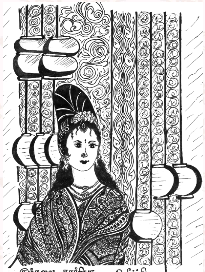
குந்தவை நாளீஸ்தயா ம.கீர்த்தி கண்தகவியல் (ஸ்தீஸ்தாஸ்த அஸ்தீஸ்த) (SSS)