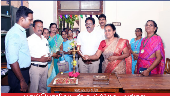
புதுப்பொலிவுடன் கூட்டுறவு அங்காடி