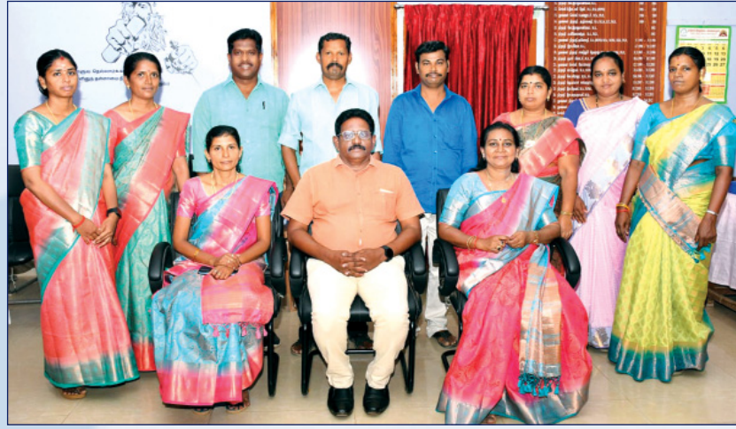
தேர்வுக் கட்டுப்பாட்டு அலுவலகம்