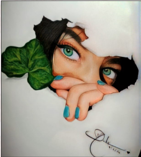
த. மெஹாபூதீ II - எம்.ஏ. ஆங்கிலம்