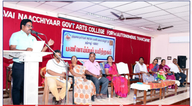
பணி வாய்ப்புப் பயிற்றகத் தொடக்க விழா