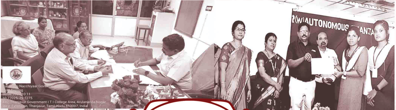
Kunthavai Naacchiyaar Govt. Arts MoU Signing 30.08.2024 10:11 10.77025, 79.1275 432, Thanjavur Government I T I College Area, Arulananda Nagar West Extension, Thanjavur, Tamil Nadu, 613007, India