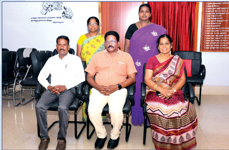
உடற்கல்வி / நூலகம்