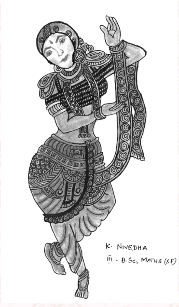
K. NIVEDHA III - B.Sc., MATHS (SF)