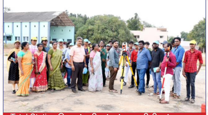
Total Station செயல் விளக்கம் - புவியியல் துறை