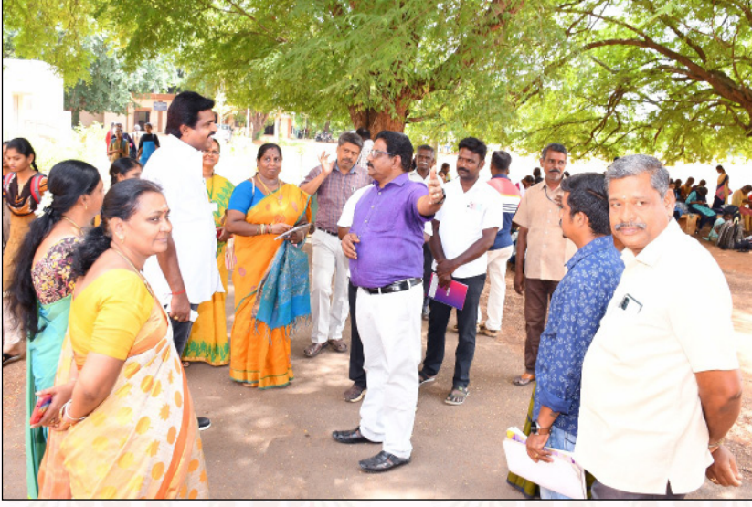
பொலிவுறு குந்தவை அமைப்பின் வளாகத்தூய்மை முன்னெடுப்பிற்கான ஆலோசனை