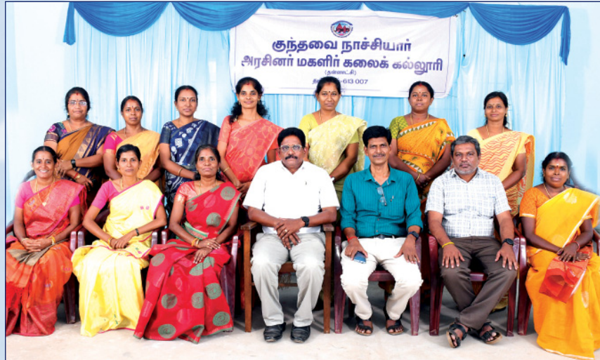
கணினி அறிவியல் துறை